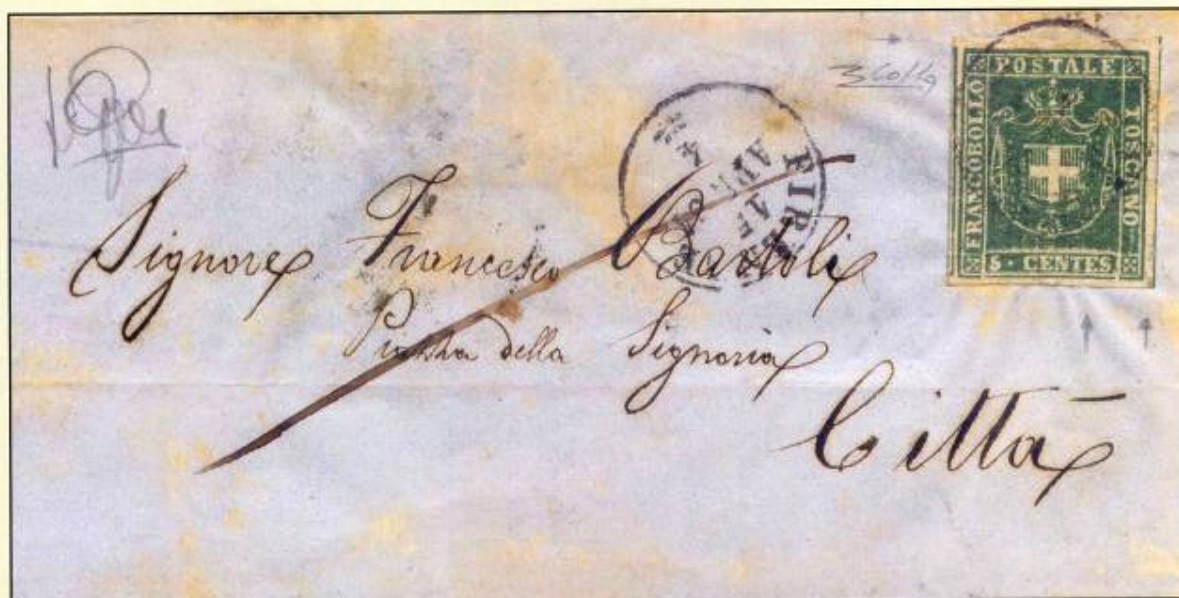
Firenze 15. 4. 1861. Cent. 5 Governo della Toscana su letterina per Città.

Rivista della Associazione per lo Studio della Storia Postale Toscana